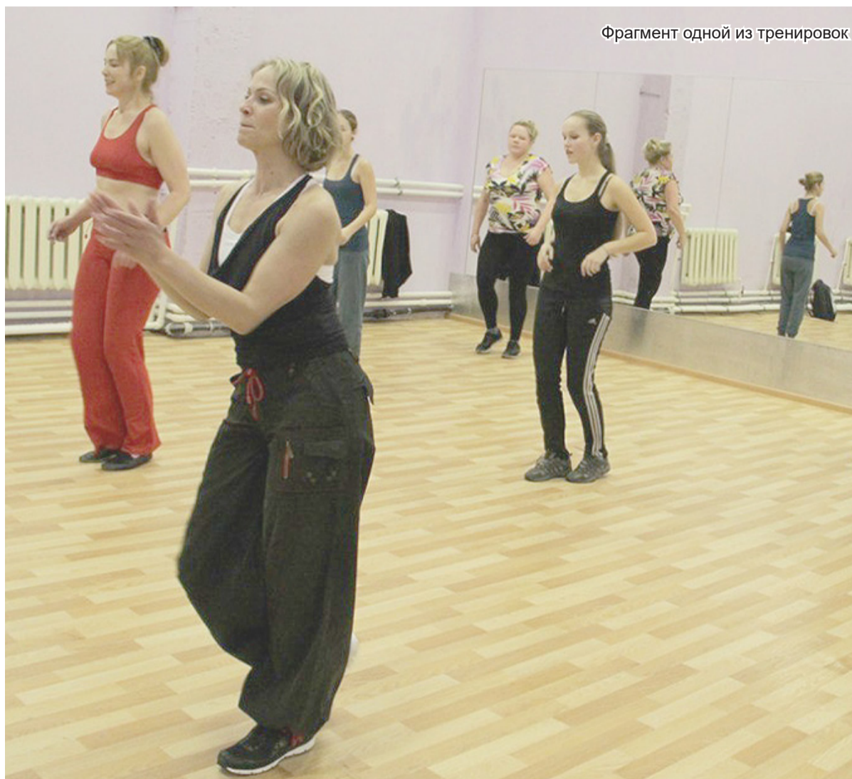
Фрагмент одной из тренировок

головой, постоянно следите за осанкой, сидя на стуле, работайте стопами, сгибайтесь и разгибайтесь коленные суставы. Если решите серьёзно, то лучше, конечно, начать с персональных занятий с тренером или в группе, но обязательно под присмотром грамотного инструктора.