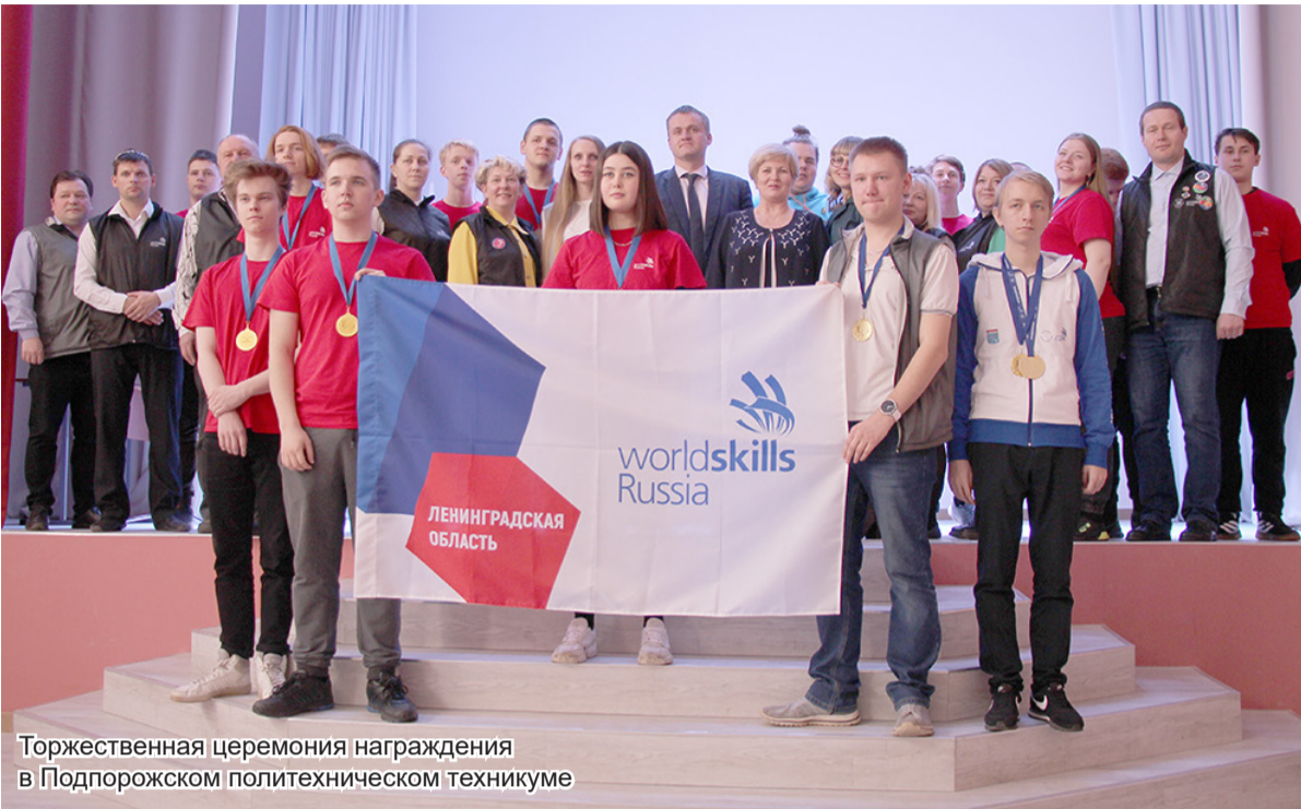
Торжественная церемония награждения в Подпорожском политехническом техникуме

В актовом зале Подпорожского политехнического техникума 1 апреля прошло чествование победителей профессиональных конкурсов «Профессией своей горжусь!».