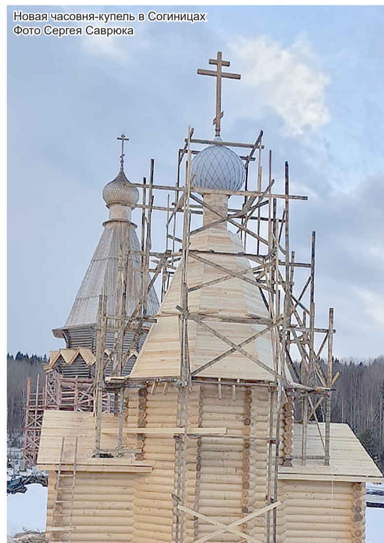
Новая часовня-купель в Согиницах

Материалы подготовлены Татьяной АНТОНОВОЙ и Антониной Герасимовой